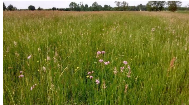
Foto natuurgrasland op Twitter

Graag wil RVV u wijzen op de cursus Inleiding beheer natuurgrasland die wordt georganiseerd door de AERES hogeschool . De cursus bestaat uit drie hele dagen en is bedoeld voor ondernemers die kennis willen maken met natuurlijk graslandbeheer, en voor loonwerkers en anderen die beheer op natuurgrasland uitvoeren in opdracht van een grondeigenaar. De cursus wordt georganiseerd in diverse regio's. Meer informatie en aanmelden kan via deze link .